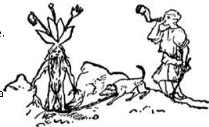
Alrune graves opp av hund. Dette er et kobberstikk fra 1700-tallet

Folk trodde også alruner hadde eget liv og egen vilje. Det gjorde at de var redde for å grave den opp. Mange myter og eventyr forteller at alruneplanten ville skrike og hevne seg på den som dro rota opp fra bakken. For å beskytte seg mot det dødelige skriket utstyrte derfor bonden seg med et tau, en hund og et horn.