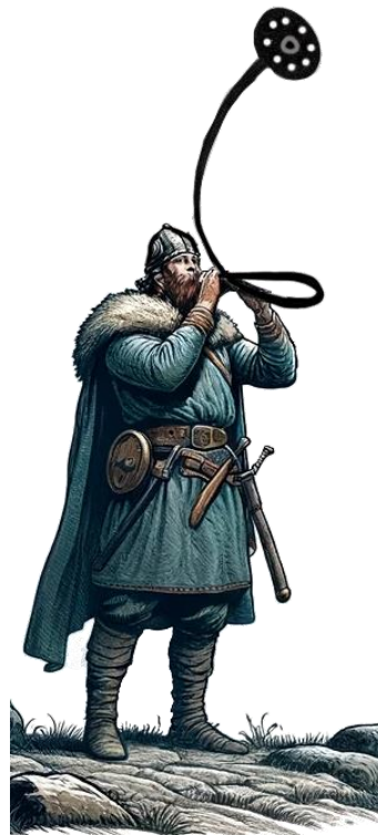
Mannen spiller på en.....