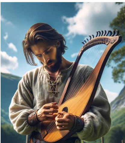
Mannen spiller på en.....

Luren er et blåseinstrument laget av bronse eller tre. Den ble bruk i vikingtiden. Luren er et langt rør med en vid åpning, ofte formet i en spiral eller med en karakteristisk bøy. De kunne være opp til flere meter lange. Instrumentene var uten fingerhull og produserte derfor kun en liten mengde toner. Lyden fra en lur er dyp. Instrumentet ble antageligvis brukt i rituelle sammenhenger, kanskje også for signalformål over lange avstander.